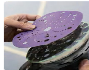
TL803 – Disco abrasivo viola in ceramica, 15 fori

Tipologia di rivestimento: Aperta (Open Coat)